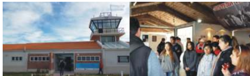
Aeropuerto viejo de la ciudad de Trelew. Alumnos en el RECORRIDO POR LA MEMORIA.

RECURSO: Leonardo De Bella RECORRIDO POR LA MEMORIA. Ejes Centrales para la Guiada con alumnos. Subsecretaría de Derechos Humanos de la Provincia de Chubut. Septiembre 2014