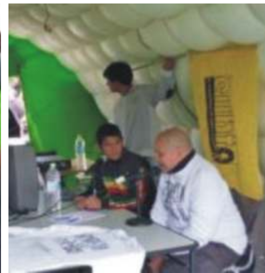
Radio Abierta | Centro Cultural. 22 de agosto 2012