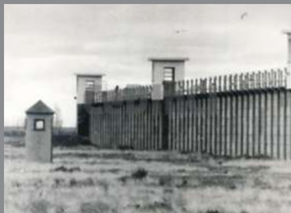
Muros exteriores del Penal de Rawson 18 de agosto de 1972.

El penal de aislamiento extremo estaba rodeado de bases del Ejército y la Marina, y ya para 1972 se encontraban en él unos 200 prisioneros.