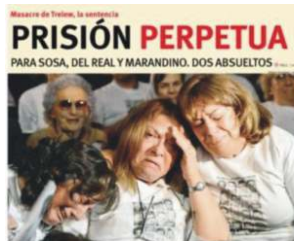
La Sentencia. Diario Jornada 16 de Octubre de 2012