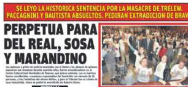
La Sentencia. Diario El Chubut 16 de Octubre de 2012