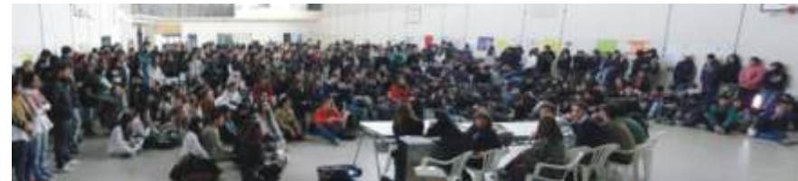
Charla en Trelew – Proyecto Redes Escolares