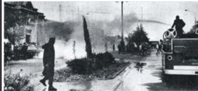
Trabajadores de la SOYEAP duramente reprimidos frente a la casa de Gobierno en Rawson. 3 de mayo de 1972.

A ello se suman otros reclamos como el de los Trabajadores del Sindicato de Obreros y Empleados de la Administración Pública —SOYEAP— reprimidos frente a la casa de gobierno. Es la primera vez que se utilizan gases lacrimógenos y mangueras para reprimir una manifestación. Protestan ante el gobernador de facto Jorge Costa por el incumplimiento del acuerdo de las condiciones de trabajo.