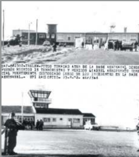
La Base Aeronaval y el Aeropuerto de Trelew.

El estado de asamblea permanente y alerta se sostuvo por casi dos meses, hasta que uno a uno los pobladores detenidos alcanzaron la libertad.