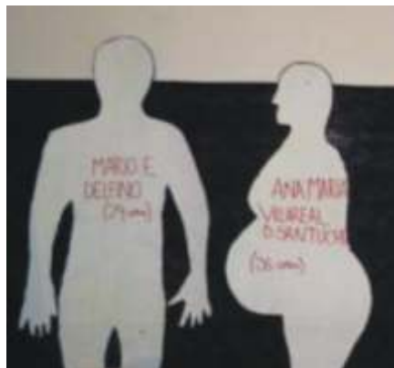
Colegios 7705 729 IMA Rawson Charlas con familiares. En el Salón están las siluetas que luego serán llevadas al Centro Cultural. 22 de agosto 2012

Este mismo día instalaron una carpa con una Radio Abierta, transmitiendo, antes, durante y después del dictado de la sentencia. Mientras tanto otro grupo de alumnos realizaba un extraordinario video de los hechos que estaban aconteciendo.