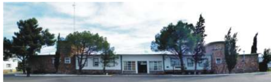
La base Almirante Zar en 2014.