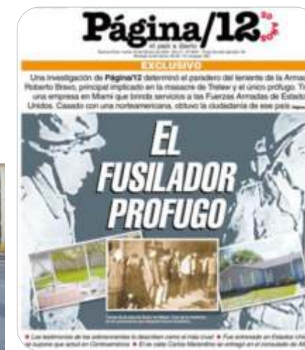
El Fusilador Prófugo. Tapa Página 12, 8 feb. 2008