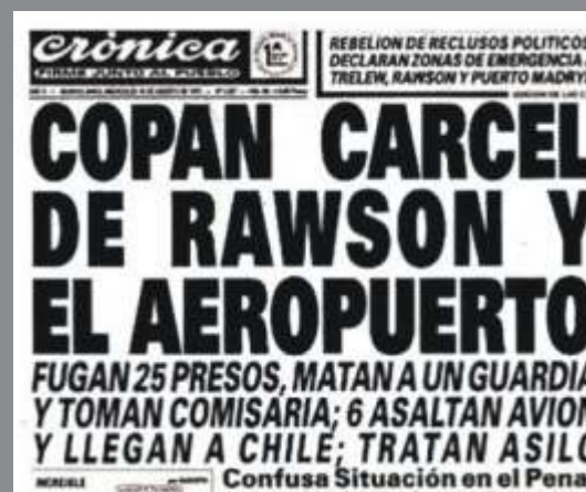
Tapa Diario Crónica 16 de agosto de 1972