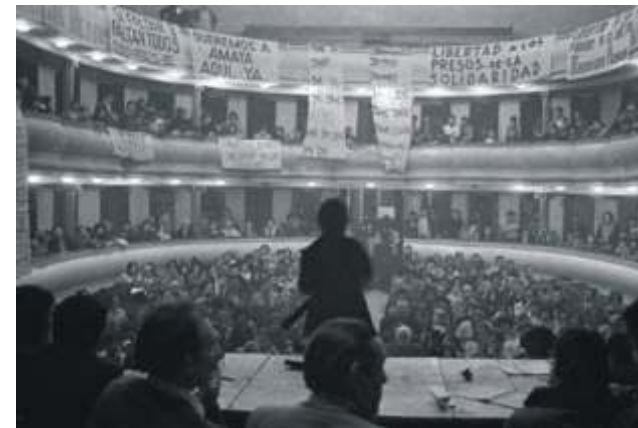
El Teatro Español durante una asamblea. 18 de octubre de 1972.

Rápidamente los pobladores del valle del río Chubut se manifestaron, y organizaron movilizaciones callejeras, una huelga general y reuniones masivas que generó una movilización popular por su liberación, conocida como Trelewazo. El Teatro Español fue tomado y elegido como el sitio de reunión de esta protesta masiva y fue bautizado como Casa del Pueblo.