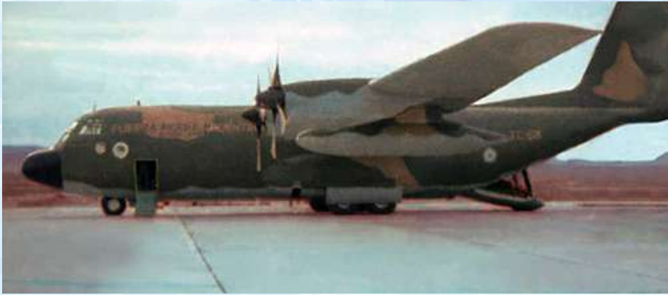
1982. Avión de la Fuerza Aérea Lockheed C-130 Hércules, en el Aeropuerto General Mosconi de Comodoro Rivadavia, durante la Guerra de Malvinas. Fondo: Ricardo Blanco. En Peralta et al. 2021

Los simulacros de ataques se repitieron en varias oportunidades. Fue fundamental la organización de la ciudad, coordinada por Defensa Civil que dispuso del nombramiento de jefe de manzanas. Los simulacros también se hacen habitualmente en las escuelas. Los colchones y las frazadas para protegerse de una eventual bomba están dispuestos en todos los salones de actos.