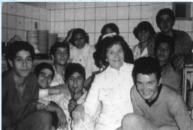
El personal médico y de enfermería, además de la profesionalidad colman de afecto a los ex combatientes. Foto: Gustavo Fernández. En Armesto et al 2001

Por si surgiera la necesidad, en los colegios secundarios se entrena a los estudiantes de 4° y 5° año para trasladar, en camillas, a los heridos. En los consultorios periféricos de cada barrio se organiza el acopio de medicamentos y otros elementos que donan los vecinos y que pudieran necesitarse en el hospital.