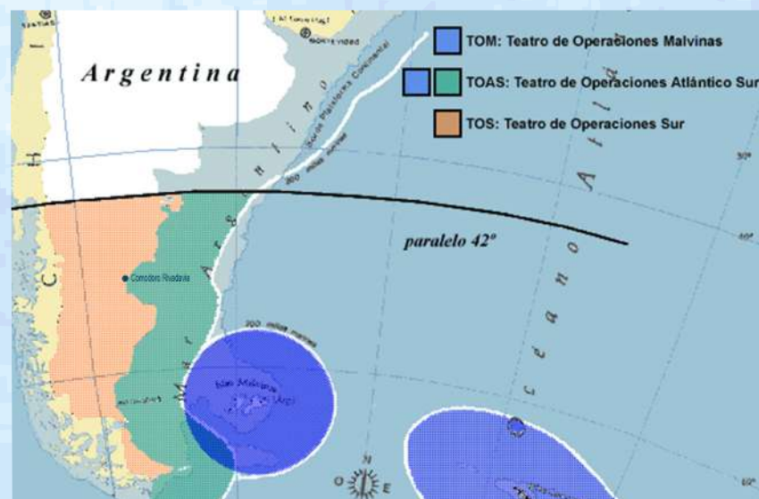
Mapa del Teatro de Operaciones del Atlántico Sur (TOAS),

A partir de allí desde el 2 de abril al 14 de junio de 1982, las ciudades costeras de la Patagonia Argentina formaron parte del Teatro de Operaciones del Atlántico Sur (TOAS). Comodoro Rivadavia fue el Centro del TOAS, lo que para la mayoría de sus habitantes significó vivir el conflicto bélico en primera persona.