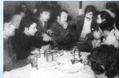
Periodistas nacionales y extranjeros llegan al centro de operaciones. Muchos 'deben' informar que el país está triunfando. Foto: Daniel Alonso. En Armesto et al 2001

También llegaron a la ciudad un centenar de periodistas argentinos y de otros países, pues no se les permitía ir a las islas, pero sí estar en Comodoro. Procedían de Japón, El Salvador, Alemania, Estados Unidos, Chile y Brasil. Se armó una sala de prensa, en el subsuelo de la Cámara de Comercio. Cada día a las 17, el jefe de Asuntos Civiles del Comando del V Cuerpo de Ejército, daba a conocer las últimas novedades del conflicto.