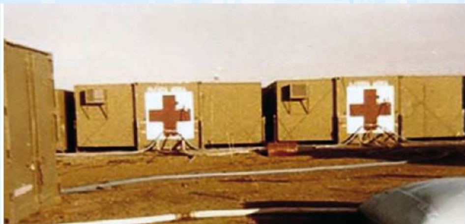
Hospital Reubicable, Comodoro Rivadavia en Gutiérrez Quiroga et al 2018

Un equipo de 14 mujeres que, aunque no viajaron a las Islas, tuvieron una participación crucial en pleno escenario del conflicto y una tarea esencial. Las enfermeras de Malvinas salvaron la vida de muchos soldados y hoy luchan por el reconocimiento de su labor.