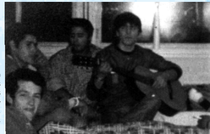
Los vecinos de la ciudad colman de afecto a los soldados y los proveen de guitarras, golosinas y elementos de tocador.} Foto: Gustavo Fernández. En Armesto et al 2001

Comodoro Rivadavia es la ciudad base de abastecimiento hacia las islas y principal lugar de evacuación de heridos. Es necesario prepararse.