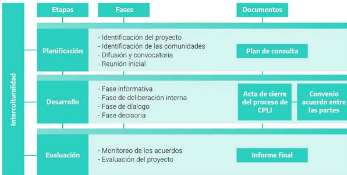
Figura 2. Modelo práctico del proceso de consulta previa, libre e informada.